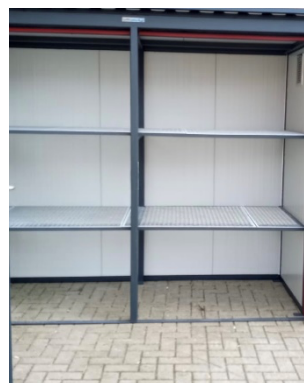
afb. binnen aanzicht, deuren van gaaswerk