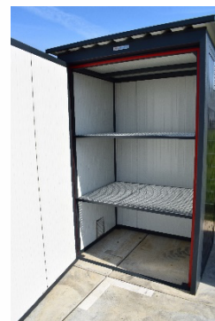
afb. buiten aanzicht afb. binnen aanzicht