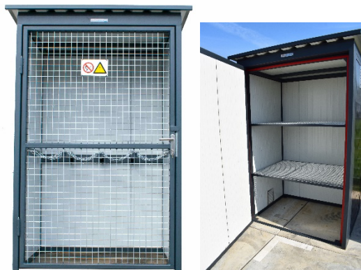
afb. buiten aanzicht afb. binnen aanzicht