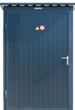
afb. buiten aanzicht