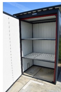
afb. binnen aanzicht