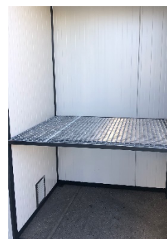
afb. binnen aanzicht