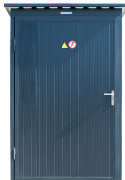
afb. buiten aanzicht